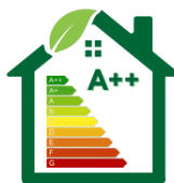
Najlepsze parametry termiczne