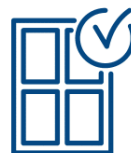
Ciepły montaż okien